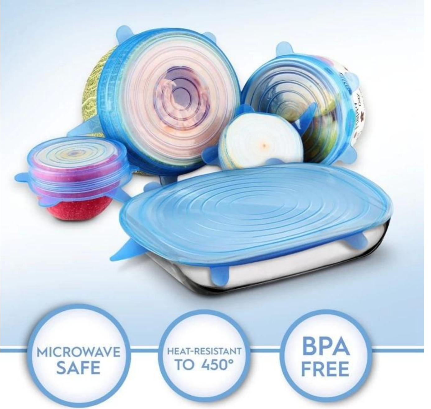
Buharlı geminin silikon kap kapağı