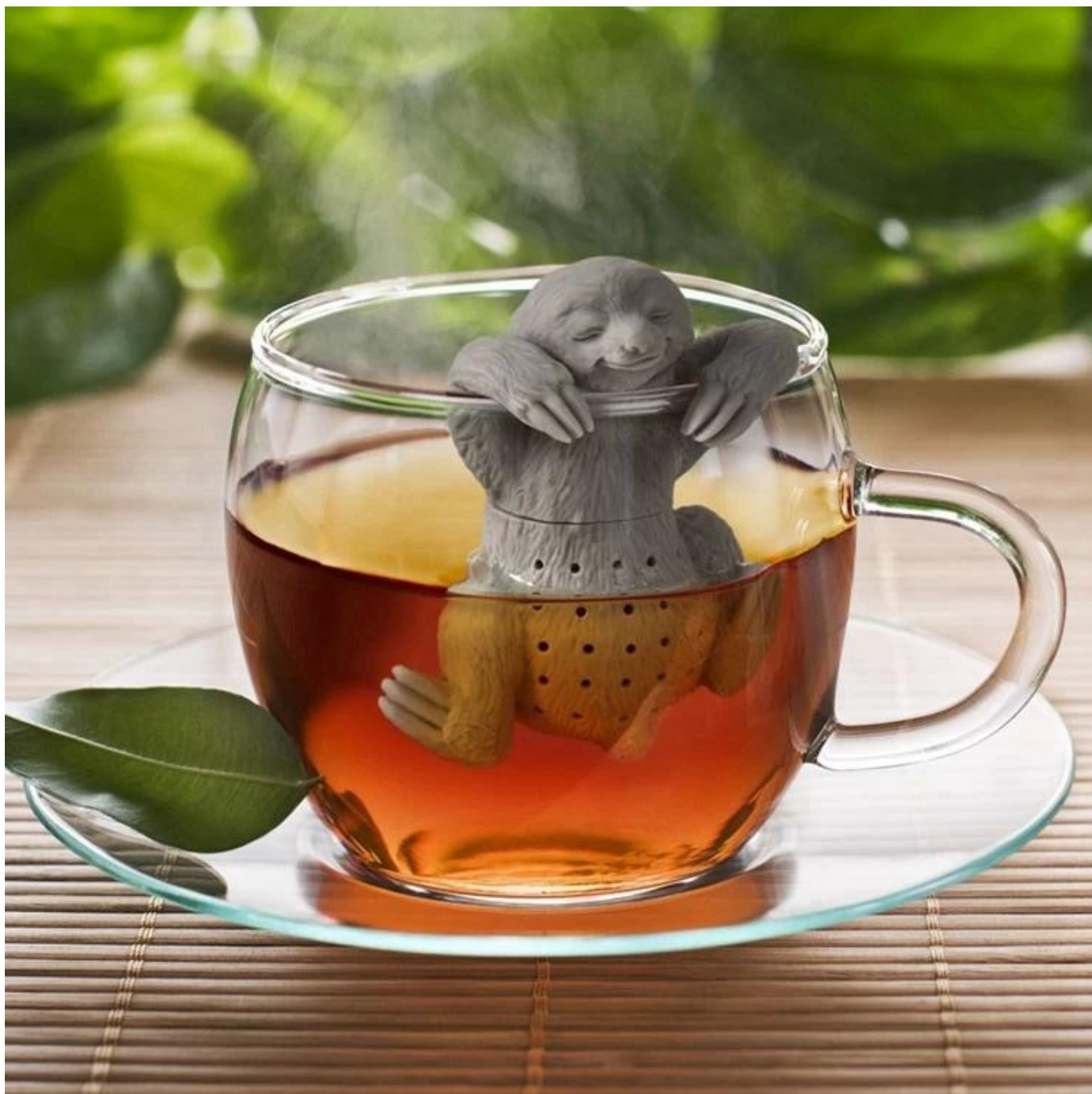
Плазменный чайный инфузор