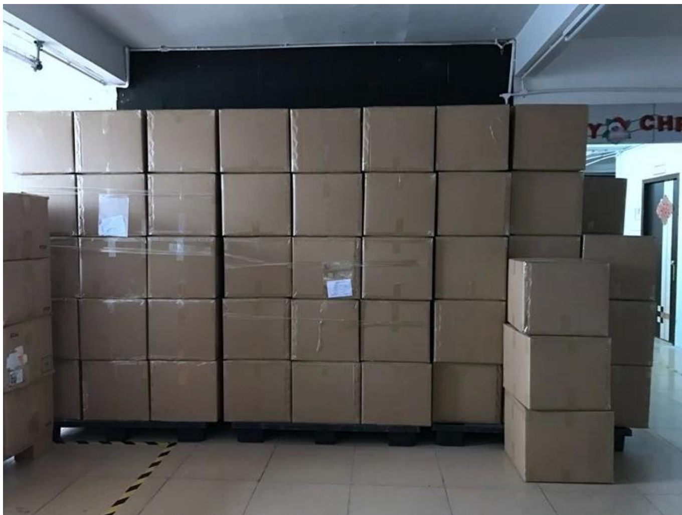
Поддон с пластиковая упаковка