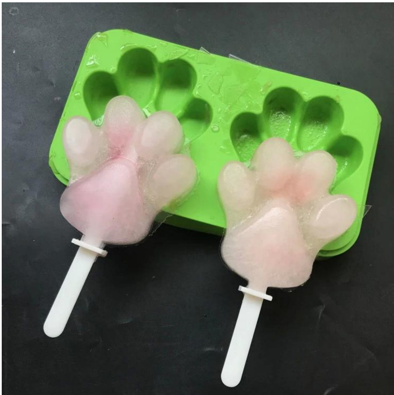
Оптовый силиконовый лоток для льда / ледяной шарик