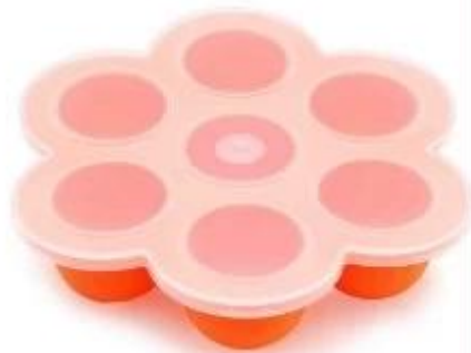
7 cup baby food storage container