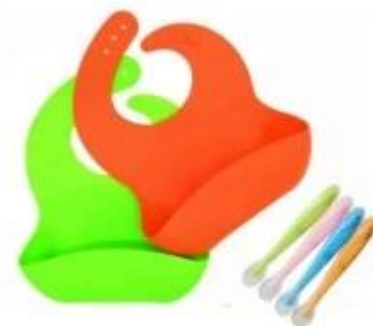
silicone baby bib+baby spoon