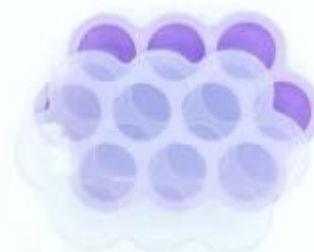
10 cup baby food storage container