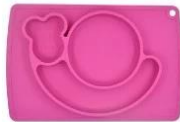
snail silicone placemat