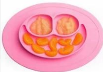
oval smily silicone placemat