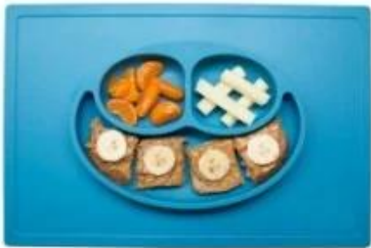
square smily silicone placemat