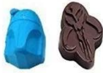
Mandalor and Boba fett