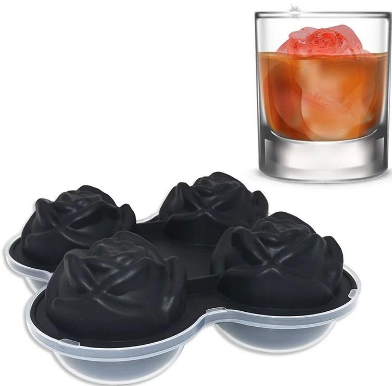
Подобный ледяной шар