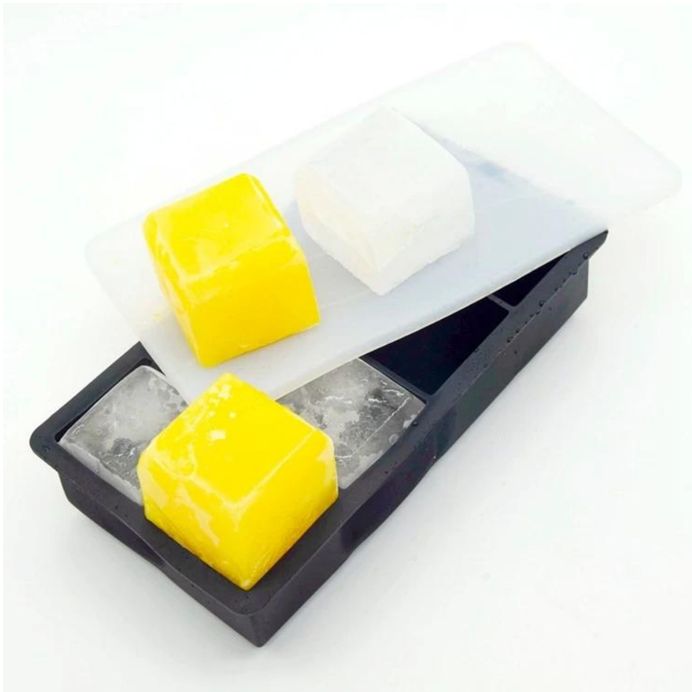
Оптовый силиконовый лоток для льда / ледяной шарик