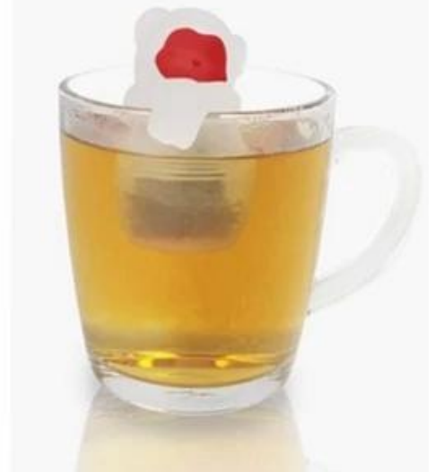
Infuser do chá do dinossauro