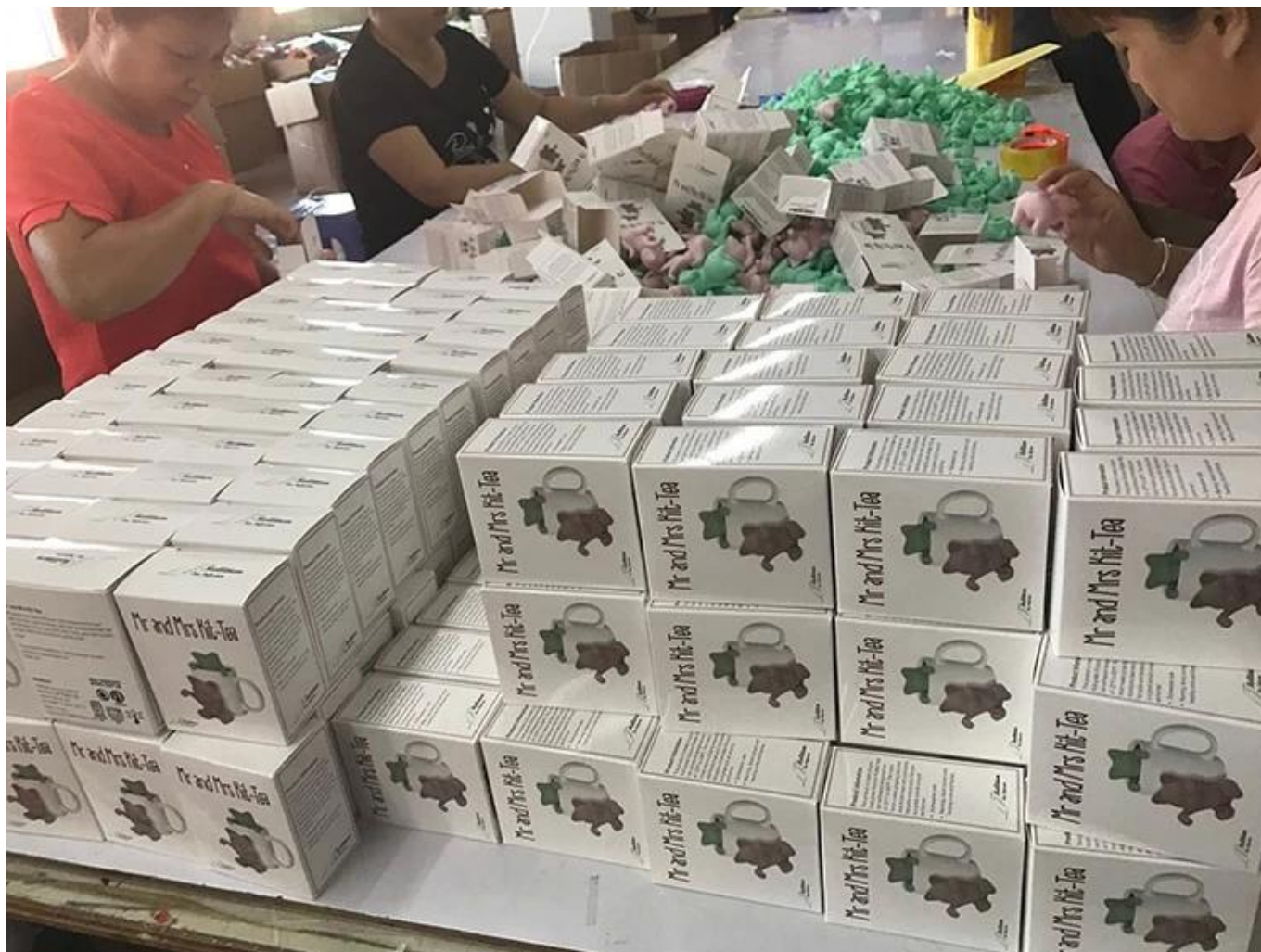
Caixa de mater