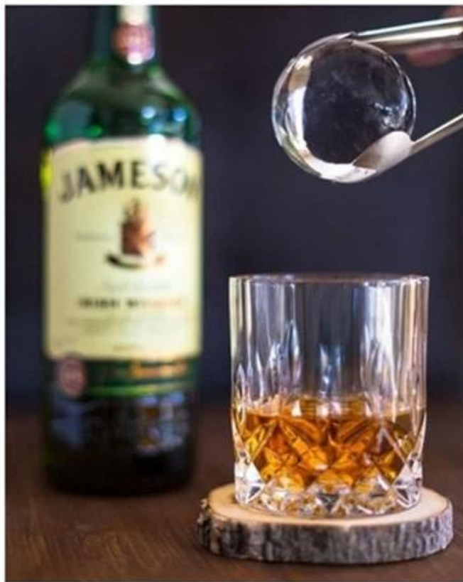
Standard Ice Ball Molds