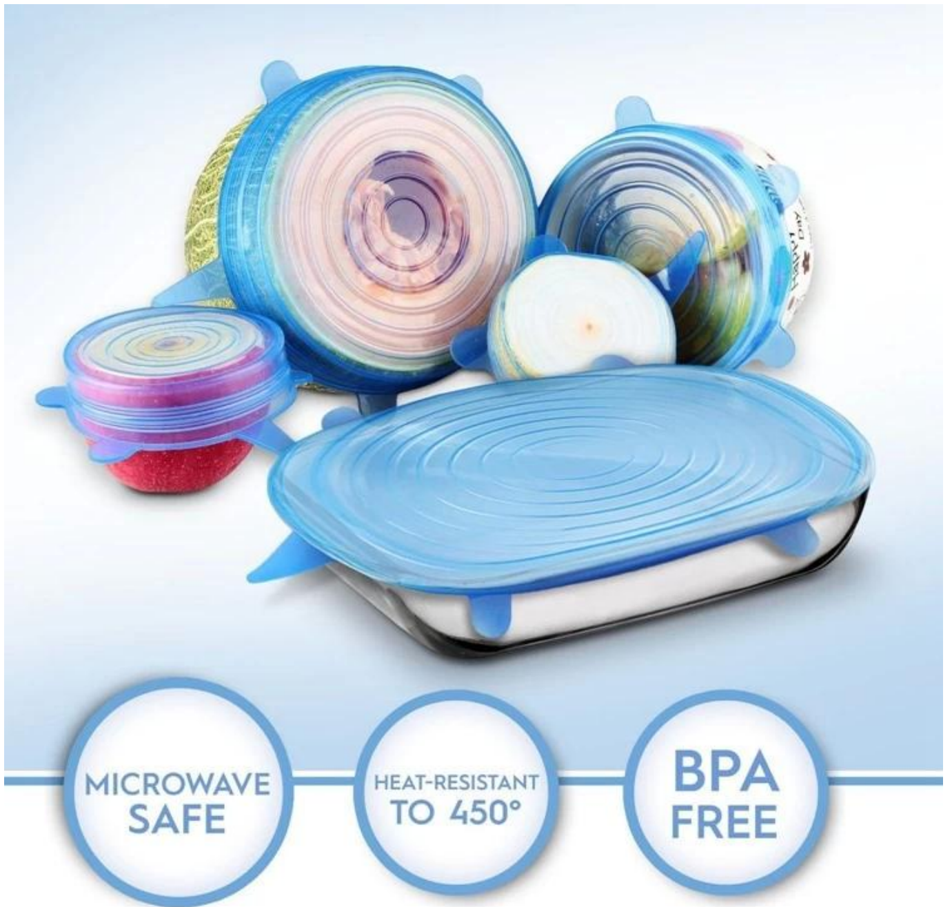
Tampa de pote de silicone a vapor