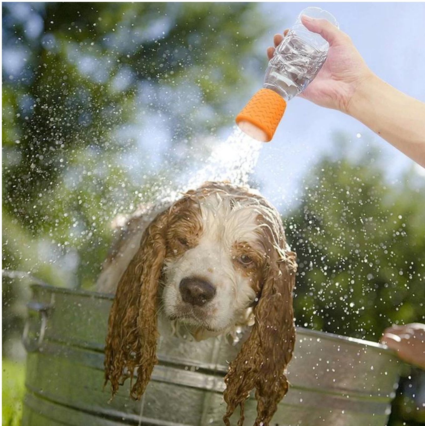
Tampa de estiramento de silicone