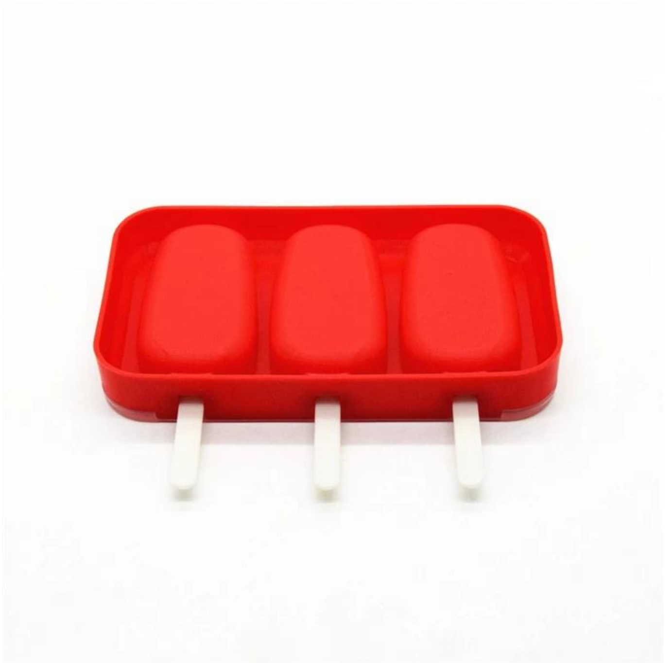
Produtos de silicone para o bebê: