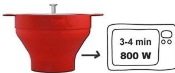
Encapsulável Silicone Popcorn Maker