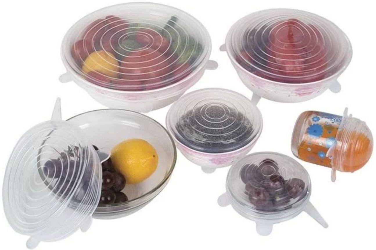
Tampa de suco de silicone semelhante / tampa de sucção de silicone