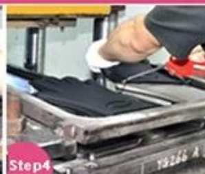
Step4 Vulcanizing and Shaping