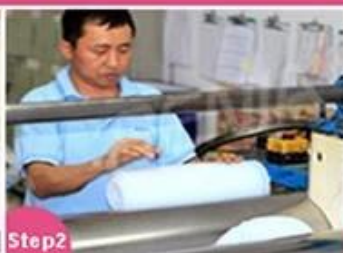
Step2 Material mixing and cutting