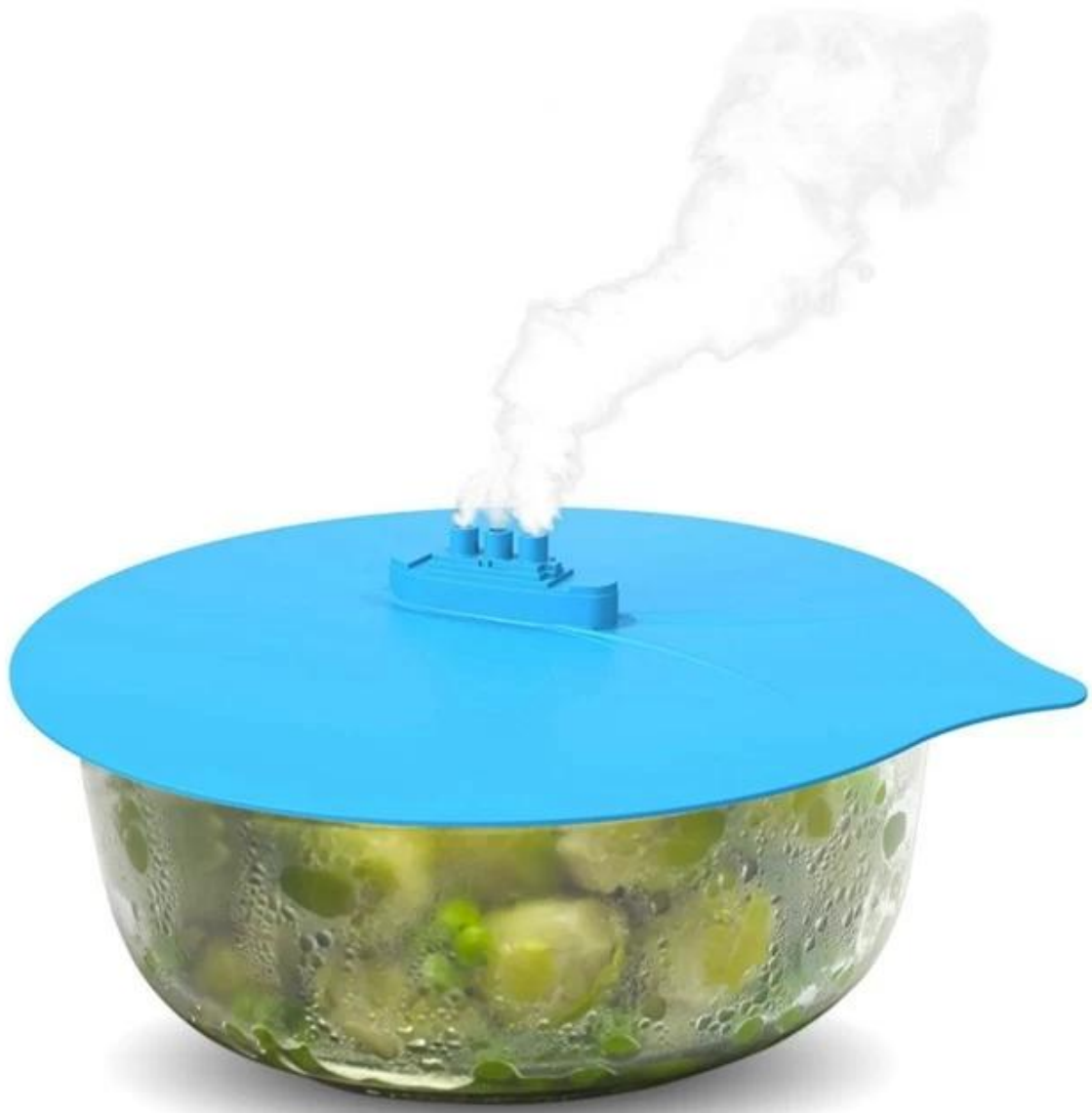
Tampa de suco de silicone semelhante / tampa de sucção de silicone