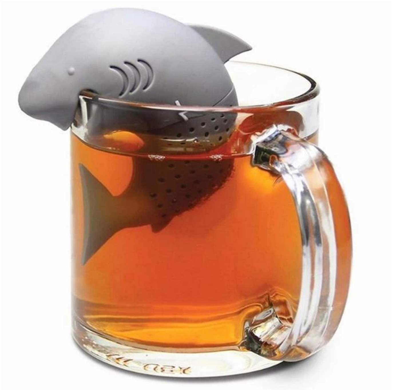
Sensível à temperatura Infusador do Tea Teamong