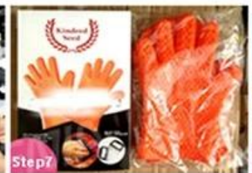
Step7 QC and Packing