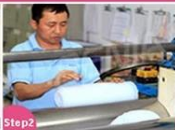
Step2 Material mixing and cutting