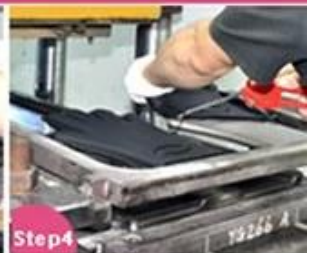
Step4 Vulcanizing and Shaping