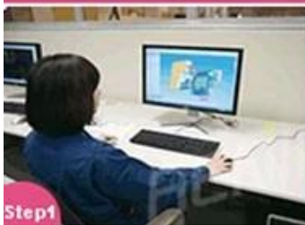
Step1 3D drawing