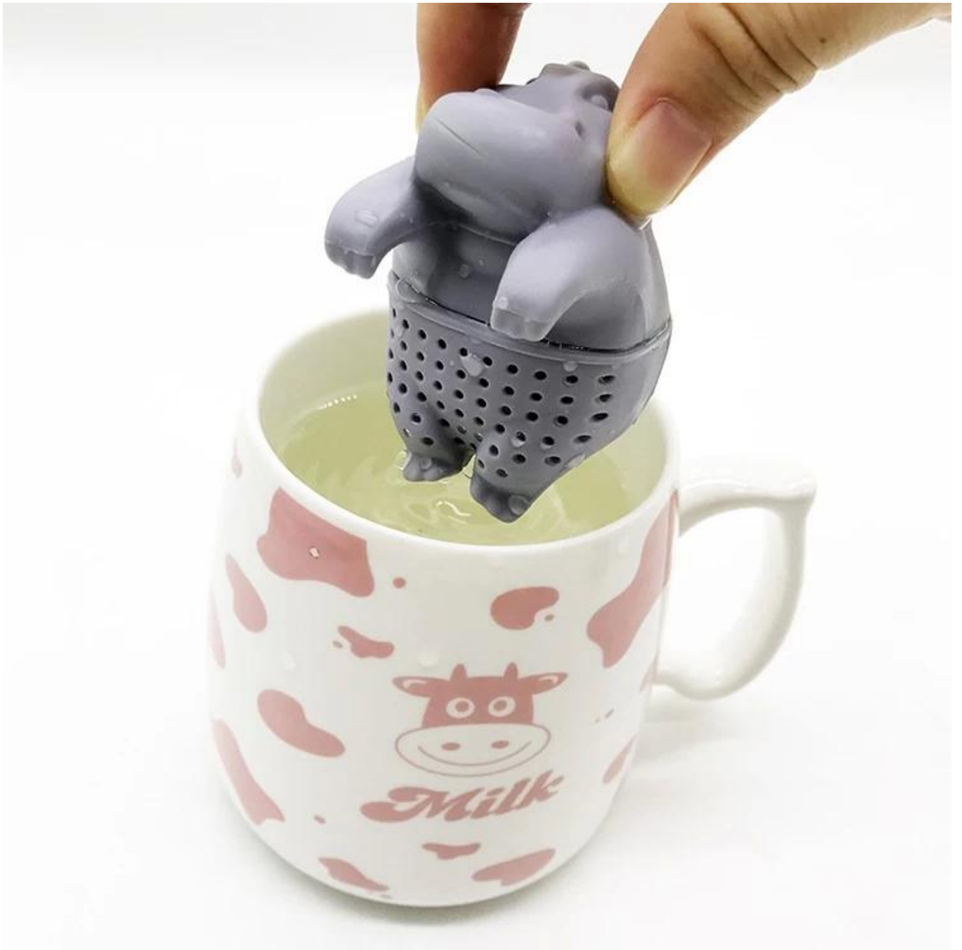
Haien Shape Tea infuser