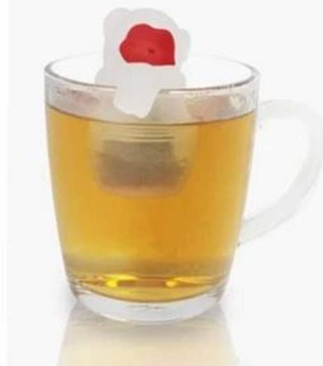
Infusore di tè dinosauro