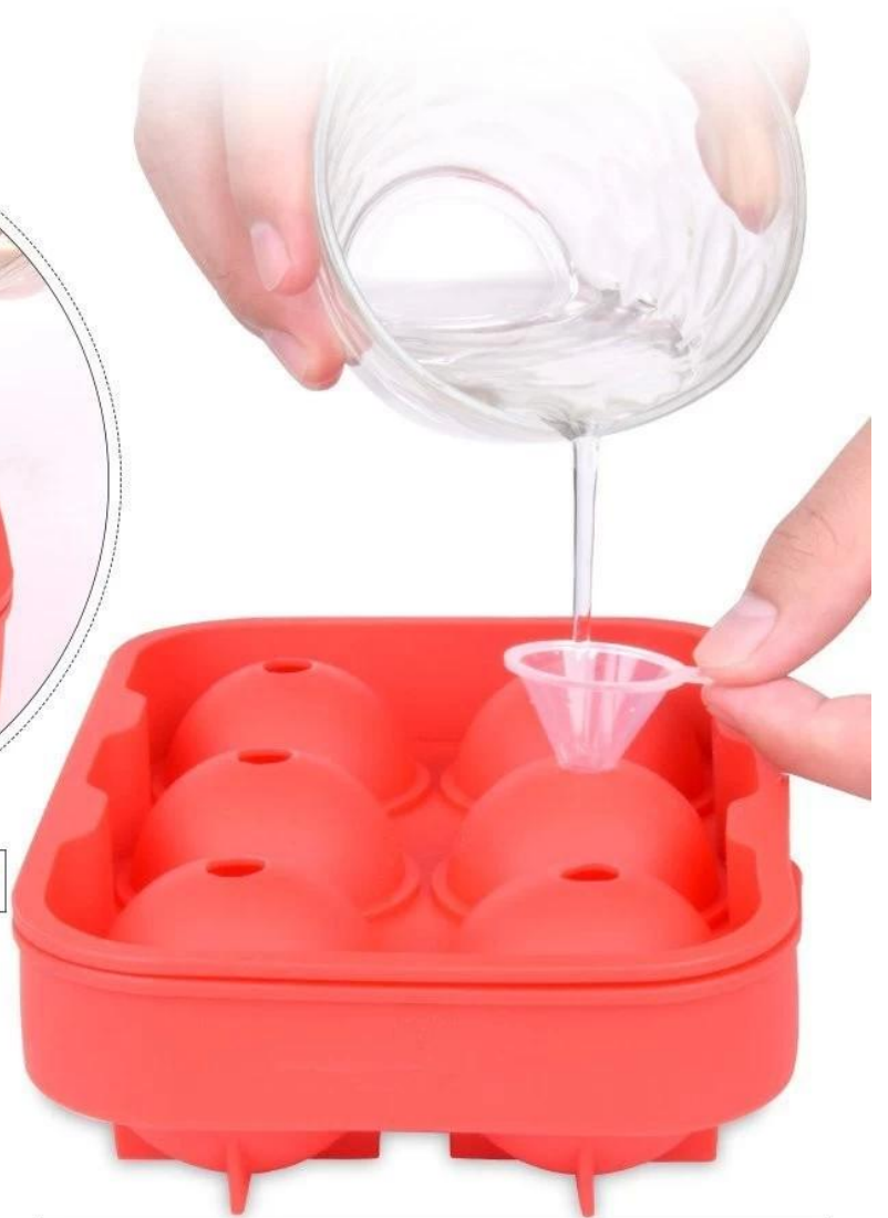
Ice Cube Tray with Plastic Filling Funnel