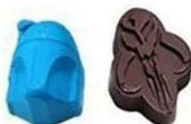
Mandalor and Boba fett