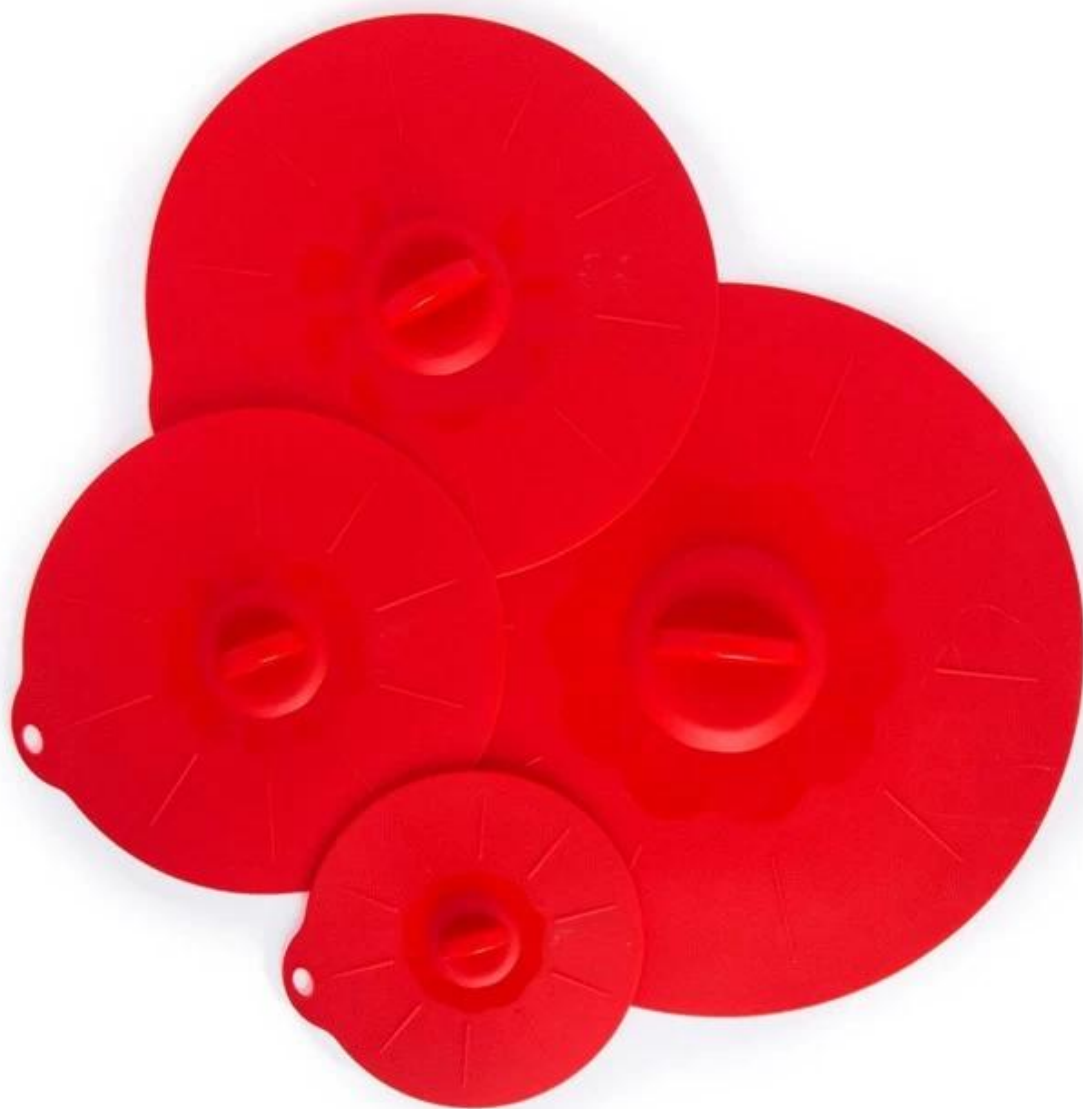
Copertura in silicone