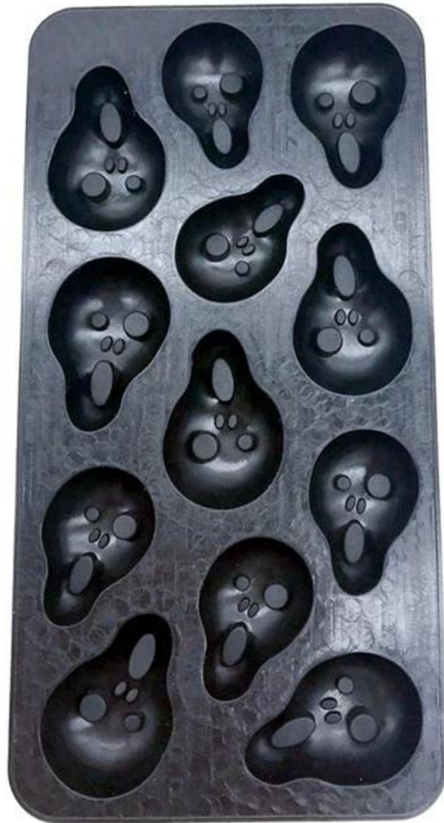
Moule à la boule de glace similaire