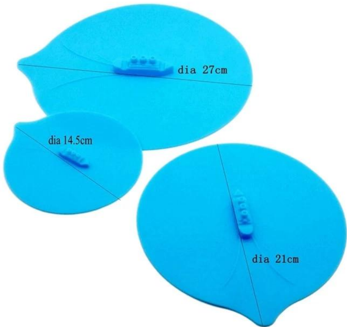
Couvercle en pot de silicone