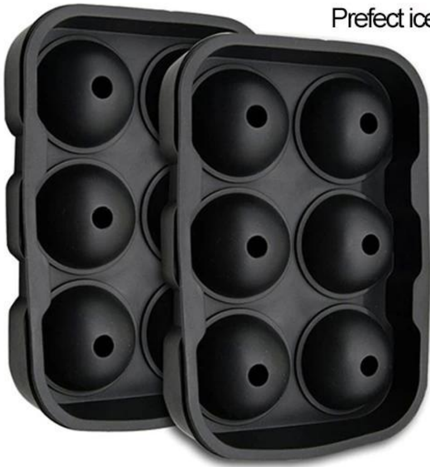
Perfect ice ball