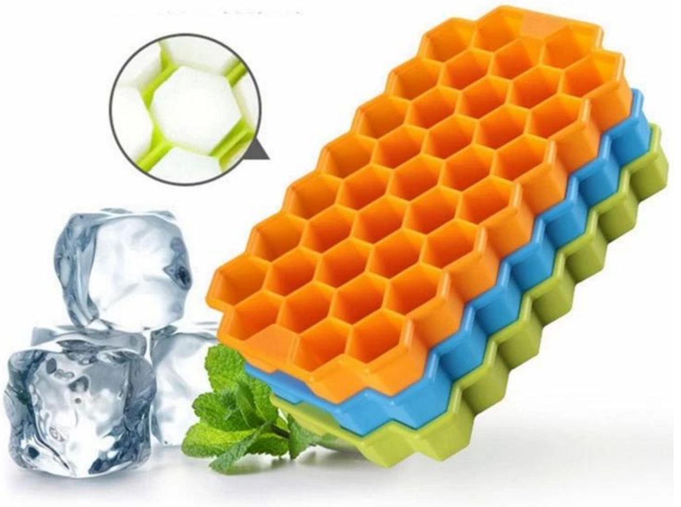
Bandeja de cubitos de hielo & conjunto de bolas de hielo