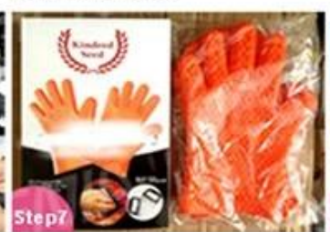
Step7 QC and Packing