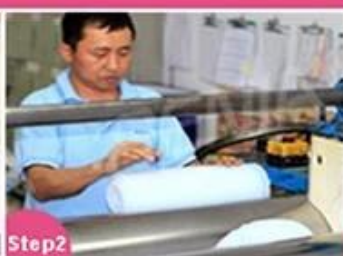
Step2 Material mixing and cutting