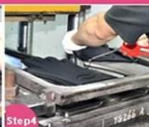
Step4 Vulcanizing and Shaping