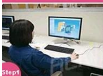
Step1 3D drawing