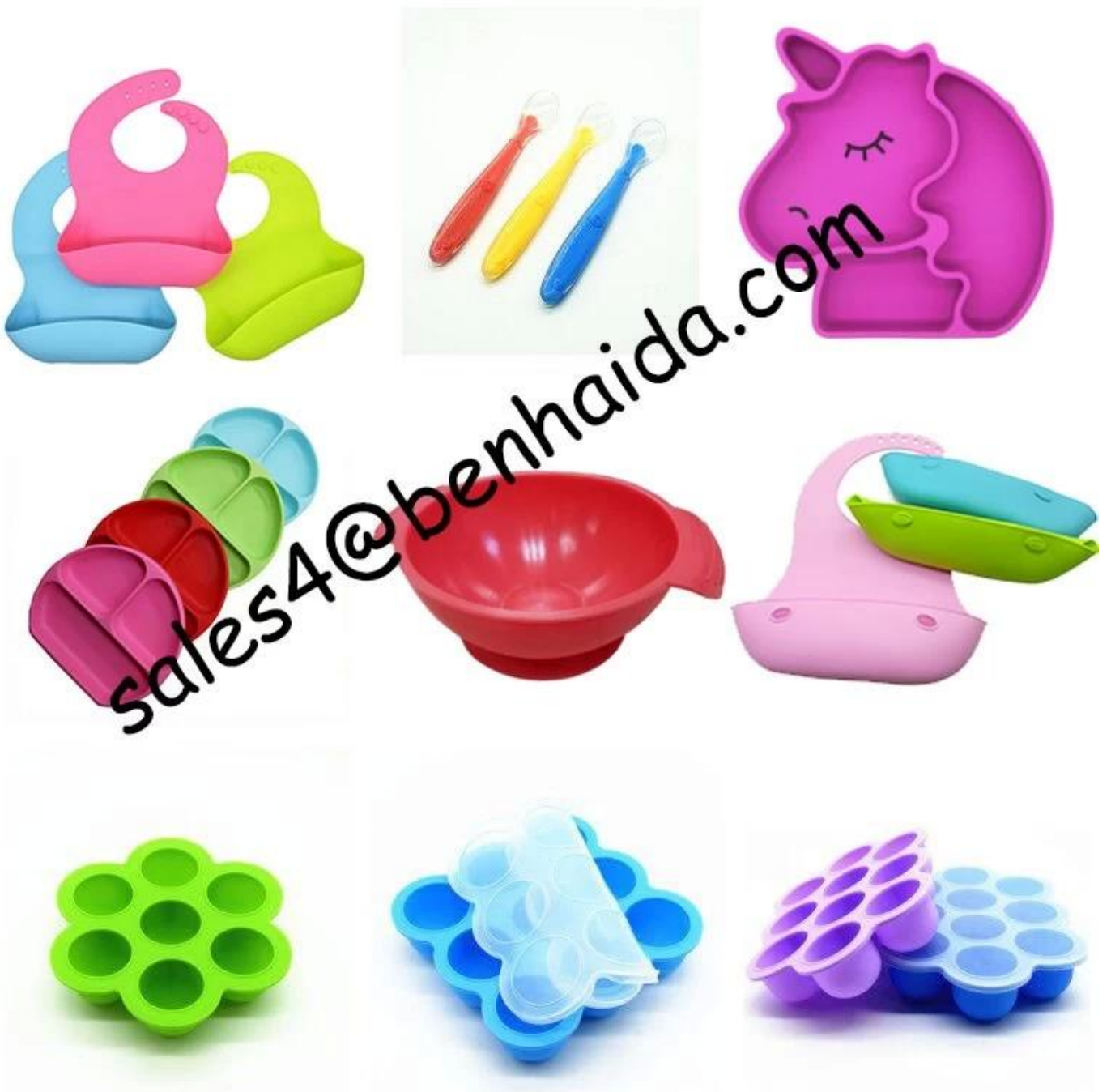
Otros productos de silicona para bebés: