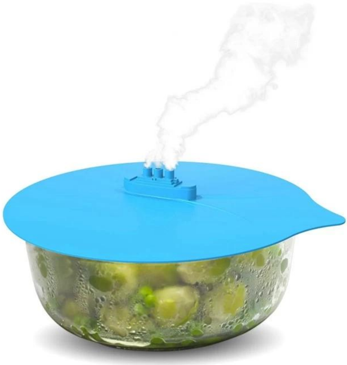
Tapa de silicona similar tapa de silicona / tapa de succión de silicona