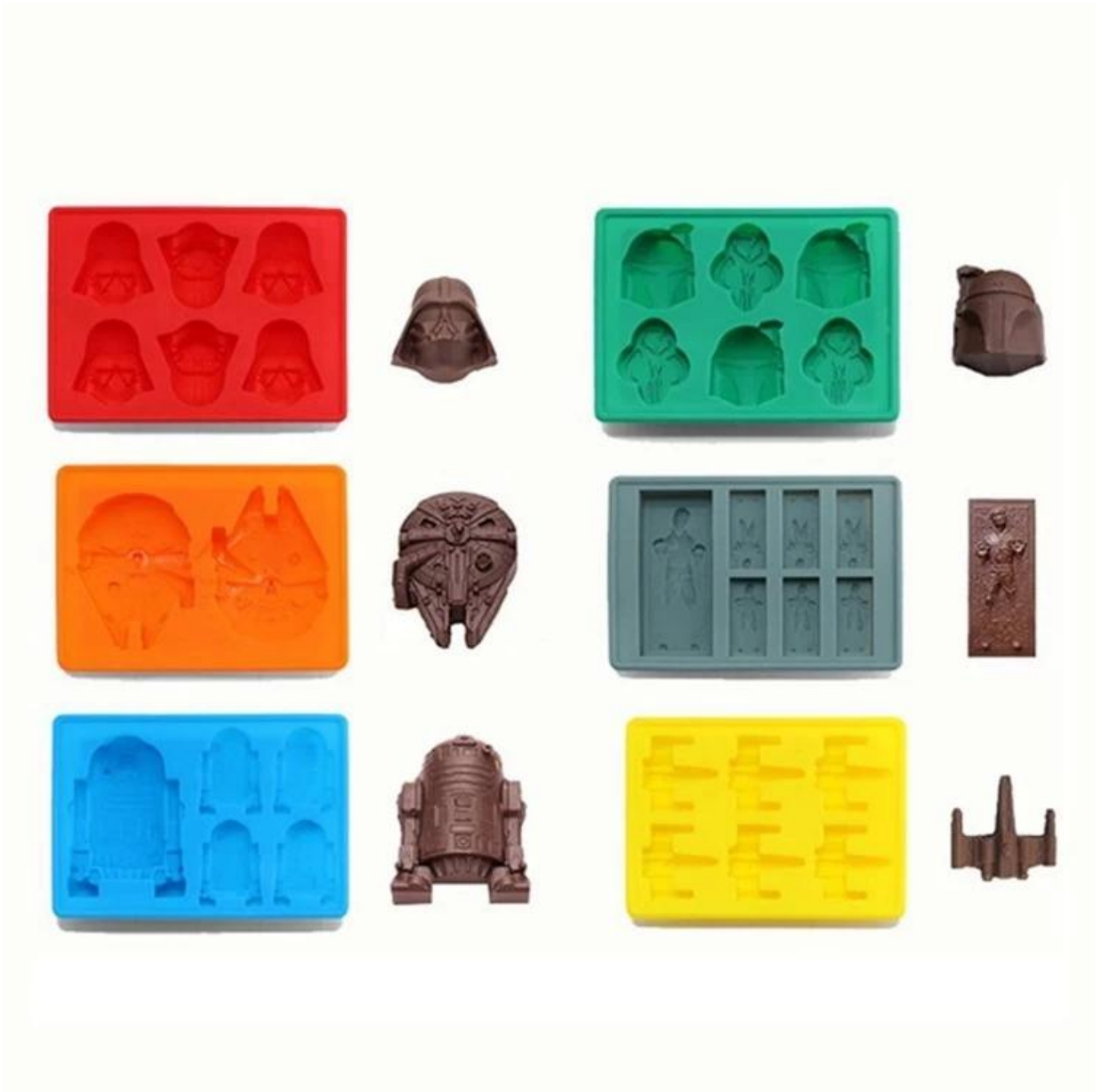
Schokoladenform mit 30 Kavitäten