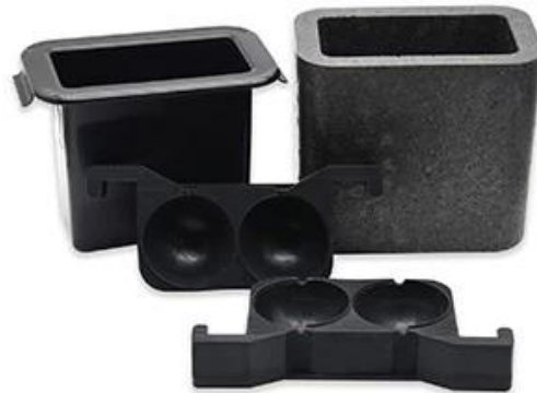
2Cavity 7.5cm Sphere