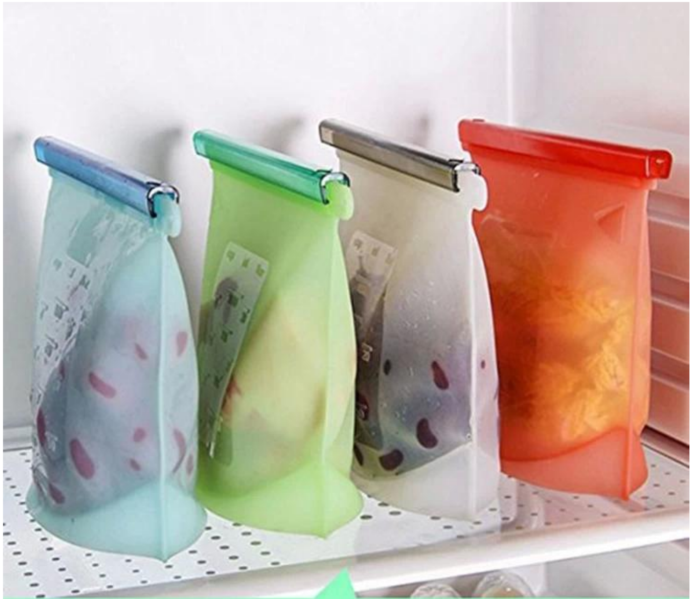
SILICONE FOOD PRESERVATION BAG