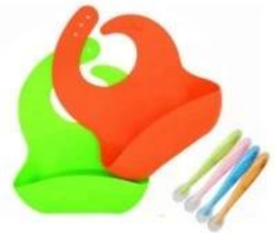
silicone baby bib+baby spoon