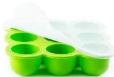
9 cup baby food storage container