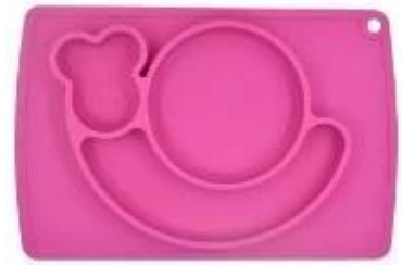
snail silicone placemat