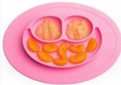
oval smily silicone placemat