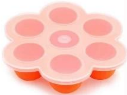
7 cup baby food storage container