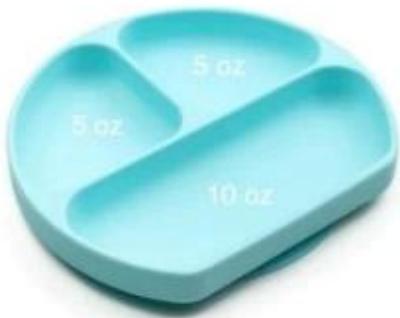
Silicone Grip Dish Placemat