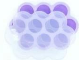
10 cup baby food storage container