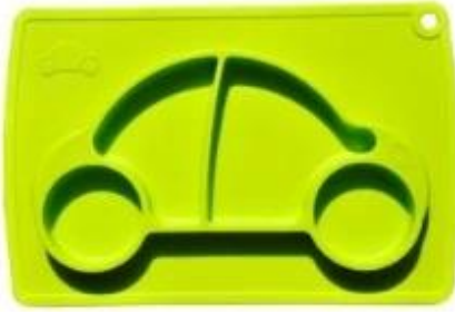
car silicone placemat