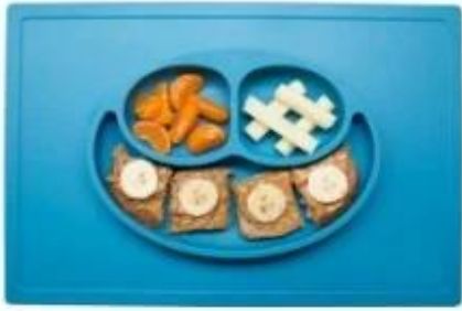
square smily silicone placemat