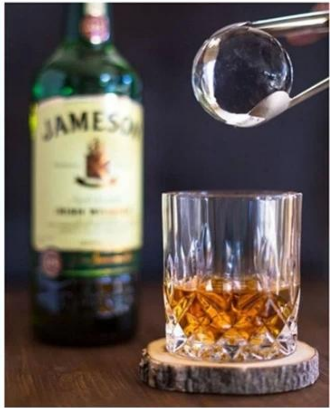
Standard Ice Ball Molds