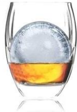
Silikon Eiswürfel Ähnliche Tray / Ice Ball Mold